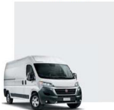
549 Bianco Ducato