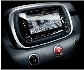
6,5" кольоровий сенсорний екран з навігацією і магнітолою, MP3, DAB, без CD