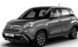
код фарби 609