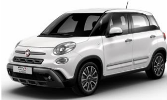
код фарби 268