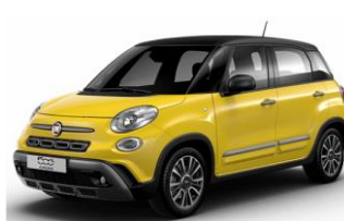
код фарби 970