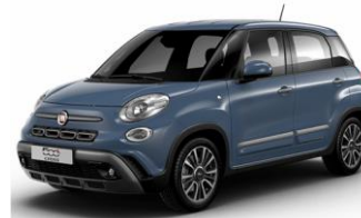
код фарби 652