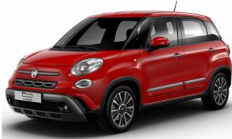
код фарби 111