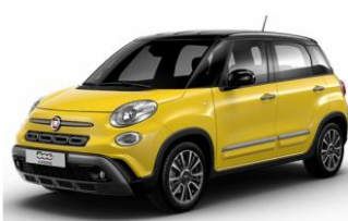
код фарби 828