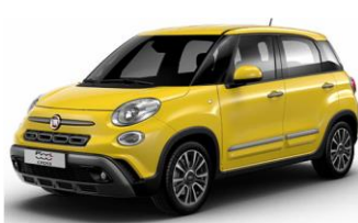
код фарби 830